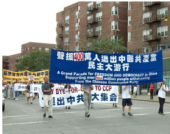
胡锦涛最怕看到这样的“欢迎场面”

【大纪元 9 月 7 日讯】原定 9 月 7 日胡锦涛对美国白宫的非国是访问，因飓风天灾而被美方“无限期推延”。胡本人是不来了，不过其近千名随行人员早已先期到达美国。据内部消息透露，他们将以“当地民众”的身份欢迎胡的到来。中国驻美大使馆利用各种手段，组织人参加胡锦涛的欢迎队伍，此举在海外受到激烈批评，媒体称这种虚假行为不是真正的爱国。此前有美国民众抗议称：由于中共全面控制着中国，胡的主要身份是中共党魁。把表示尊敬的 21 响礼炮给予一个屠杀了八千万国民，比纳粹集团更危害人类的中共党魁，是布什政府的耻辱。原中国驻澳洲大使馆政治参赞陈用林，在谈到他过去工作经历时披露，2003 年胡锦涛访问澳洲时，悉尼总领馆上上下下足忙了两个月，为确保胡“看不见、听不见”请愿呼声，要从“海陆空”全面部署安全措施。陈还说，西方国家对安全的理解是对领导人人身安全的保护，而中方则是从信息等多方面把人民当作“恐怖分子”来防范……有学者称，中