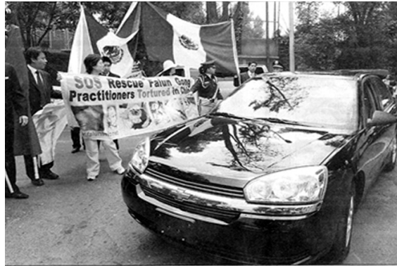
CONFLICTO Activistas de derechos humanos y simpatizantes del gobierno chino se enfrascaron en un pleito de banderas

12 日胡访问墨西哥议会时，警察在左侧早已摆好栏杆，防暴警察严阵以待。亲共人士陆续聚集在此，法轮功学员在栏杆旁打出巨大中、英、墨文横幅：“停止迫害法轮功”、“法办江泽民、法办罗干、法办刘京、法办周永康”、“法办迫害法轮功的恶警和坏人”、“胡锦涛，神和人民给你的时间