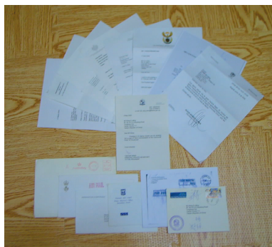
各国元首感谢与肯定之部分回函

当时全球50个大城市已举办过约300场的九评研讨会和近百场的公众集会/游行，3000多个知名学者专家、政要侨领、民主人士和受害民众参与研讨或公开站台。