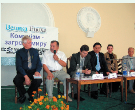
乌克兰九评研讨会

九评研讨会的邀请发出去之後，得到社会多方的积极反响。乌克兰共产党和中国大使馆对此纷纷感到不安。中国大使馆的新闻负责人员亲自打电话给研讨会的主要组织者，希