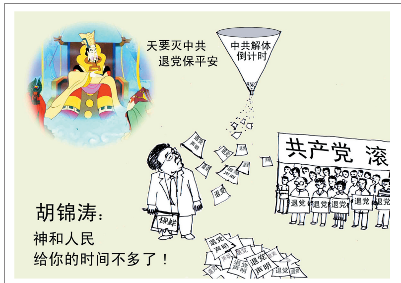
3. 文明几毁灭 道德尽沦落 一朝得九评 十亿见光明