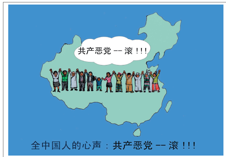
2. 良知从心起 正念除邪灵 人人明是非 恶党灭尽净