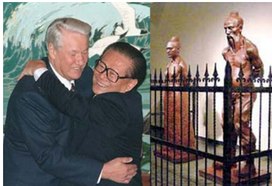
投怀送抱的卖国贼江泽民及秦桧站像

【人民报消息】最近新华网让网友讨论是否让卖国贼秦桧站起来，在江泽民盘踞的上海还展出秦桧的站像！原来江鬼不但把黑龙江的土地送了，还把新疆西部的土地也白送出去了！一位网友刊登出一篇文章和几张图片，揭露江泽民和中共的卖国罪行。这位细心的网友用中国地图出版社2005年1月新版的《新疆地图》和手头保存的2002年1月版新疆地图进行对比，发现在2005年版地图中，虽然新疆西部国界在帕米尔仍沿用“未定国界”，但是在中哈、中吉、中塔其他地段的国界已经悄悄改画。这可以看作中国与邻国的边界条约的最新标定。在中哈边界上，中国地图上的边界至少在两个地方后退，大家可以对照（图中圆圈内）。