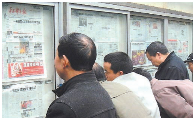
中国新闻自由指数排名世界倒数第九