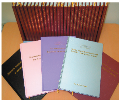
多国语言之烫金彩色版

《九评共产党》是全球发行最广华文报「大纪元时报」於2004年11月18日起，发表的系列社论，给为祸人间一个多世纪的国际共产党主义运动，特别是中国共产党盖棺论定。《九评共产党》被喻为是一本震撼全球华人、解体中国共产党的书。目前被翻译成英文、俄文、意大利文、日文、越南文、西班牙文、韩文、法文、捷克/斯洛伐克文、德文、瑞典文、波斯尼亚/克罗地亚/塞尔维亚文、荷兰文、拉脱维亚文、希伯来文、保加利亚文、保加利亚文、印度尼西亚文、土耳其文、罗马尼亚文、芬兰文、挪威文、波兰文等20多种语文，在全球和中国迅速流传。