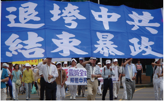
台湾上万民众在台中市举行声援退党游行 (8/28)。