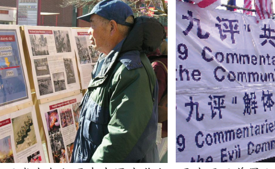
加拿大亚省卡尔加里在中国城举办集会和图片展 (10/23)。