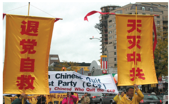
来自美国，加拿大，欧洲和其它地区的数千民众在纽约法拉盛举行游行集会 (10/22)。