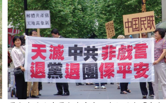
可爱的悉尼小天使也来声援退党 (10/15)。