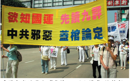
香港九龙区举办“声援500万人退党 迎接新纪元”大游行(10/23)。