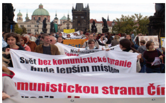
来自欧洲十四个国家的民主人士在捷克首都布拉格游行，声援中国退党潮 (10/1)。