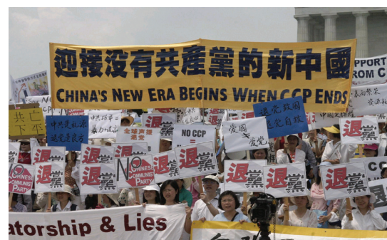
二千多中西方民众聚集在美国华府林肯纪念馆前举办声援中国民众退党集会 (7/22)。

500万人退党，是一个重大的里程碑。它所反映的是中国整个社会的精神觉醒、道德复苏。不管中共如何对民众进行政治洗脑、资讯封锁，政治监控和迫害，中共的解体已经无法避免。它向世人宣告，中共正在解体，一个没有共产党的新中国即将诞生。