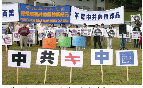
亚特兰大民间人士聚集百福大道旁，举行声援五百万中国人退出中共的集会 (10/22)。