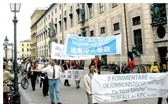
德国和奥地利的民众参加「对中共说不！」游行 (10/1)。