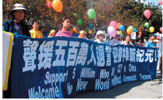
旧金山中国城花园角，举办声援500万人退党的集会游行 (10/15)。