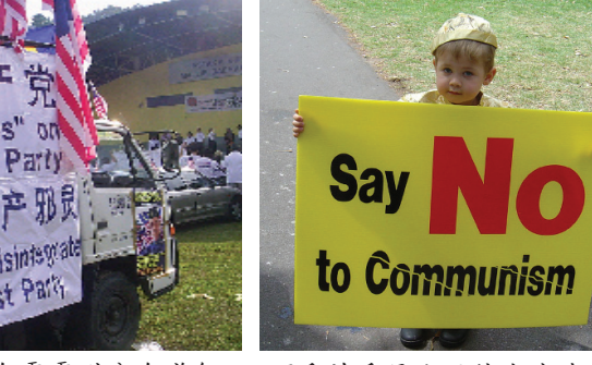
马来西亚前军人协会霹雳州分会举行国庆月摩多车和汽车游行 (9/17)。