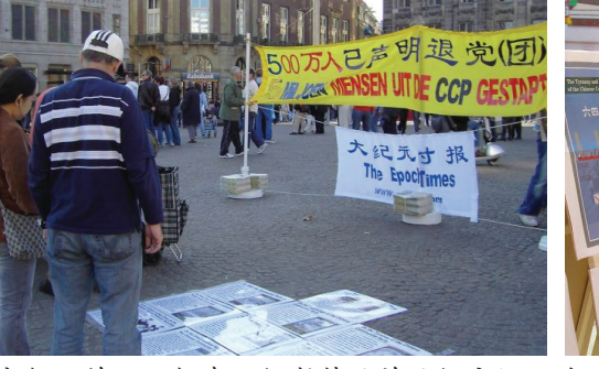
大纪元的义工们在阿姆斯特丹的丹姆广场举办九评图片展 (10/16)。