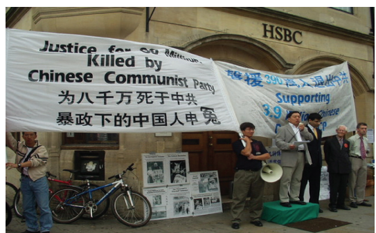
英国著名学府城牛津市中心举行《九评共产党》演讲集会 (8/27)。