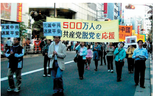
日本东京举行集会游行声援500万人退出共产党(10/23)。