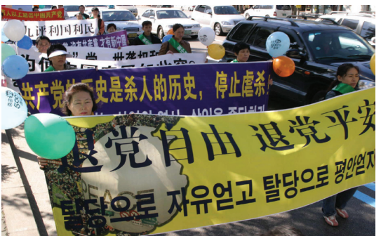
韩国各界团体集会游行声援500万人退出中共 (10/23)。