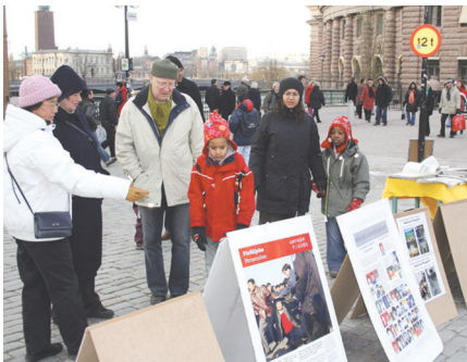
钱币广场（Mynttorget）上的民众观看图片展。

12月10日是世界人权日。瑞典斯德哥尔摩市中心的钱币广场（Mynttorget）举办九评图展及声援600万中共党员退党活动。