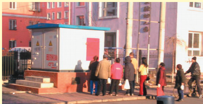
2004年11月吉林市区大幅“退党声明”吸引路人。