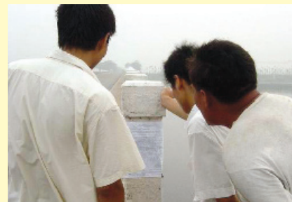
2005年7月中旬芦台大桥桥头的的人们相争细看退党声明。