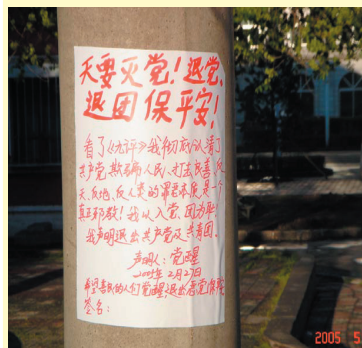
2005年4-5月间哈尔滨市出现大量退党声明。