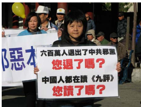
12 月 3 日旧金山声援 600 万退党