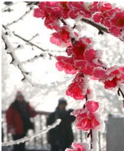
中国吉林新年前夕的腊梅。

【大纪元 12 月 31 日讯】在这新年喜庆的时刻，我们谨代表大纪元新闻集团全体员工，对广大读者和商家给予的支持表示感谢，并致新年问候。在过去一年里，大纪元继续秉承独立、公正、自由、博爱之理念，一以贯之，为维护言论和信仰自由，为捍卫民众知情权而不遗余力。大纪元在海内外的影响力正与日俱增。