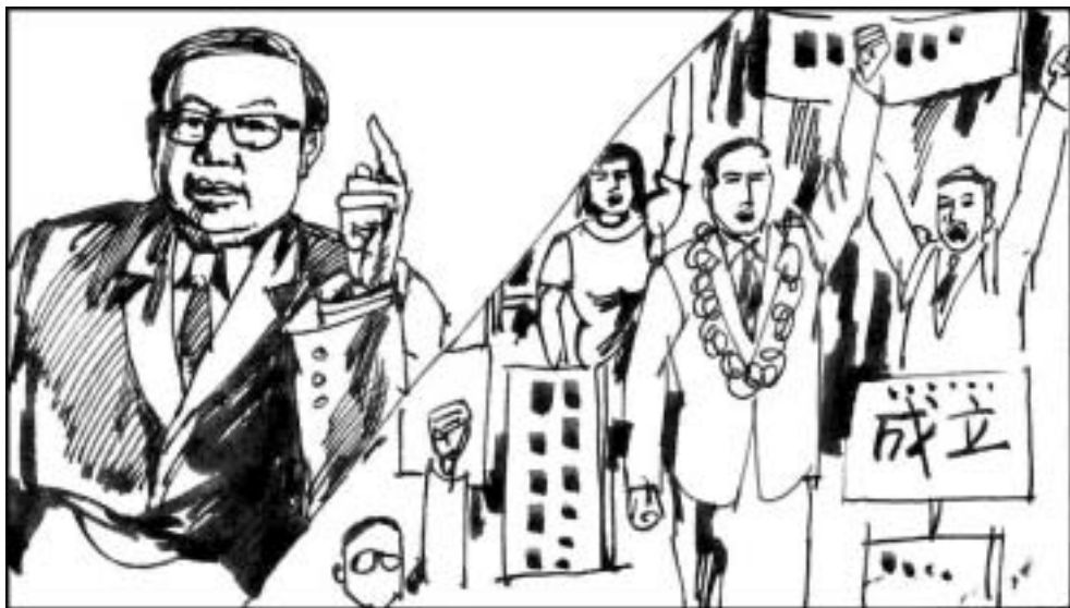
3. 当时中国民主萌芽，中国科大副校长方励之从美国普林斯顿大学进修后回国，发表了一系列演讲提倡民主理念。当时在同属中华民族的台湾第一个反对党“民主进步党”成立，十四年后这个党在大选中获胜执政台湾。