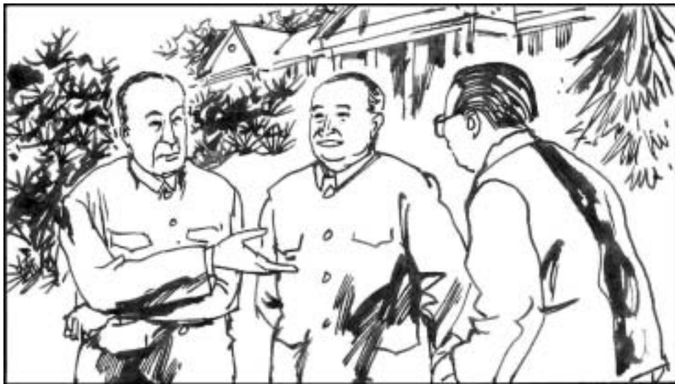
1. 上海市委书记陈国栋和上海市长汪道涵曾是江泽民六叔江上青的老部下，深得江上青提携之恩，为了报答这个人情，大力推荐冒充“江上青养子”的江泽民为上海市长。