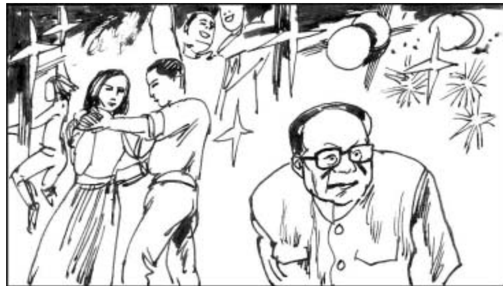
14. 江泽民关闭所有学生社团和刊物，除了舞会不许搞学生集体活动，用声色犬马转移学生对民主和人权的关心，使学生只知享乐，不问国事。因此 89 年学潮其它院校的学生都游行时，上海交大的学生还在天天开舞会。