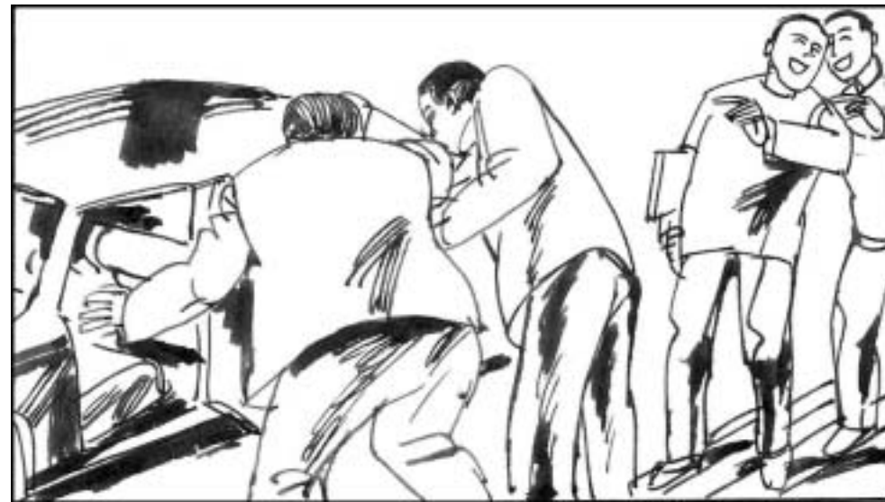
10. 学生们情绪激动的和江泽民对峙。江两腿发软，谎称有外事活动，慌忙逃离会场。出门时一头撞在半开的门上流了很多血。江顾不上包扎，用手捂着额头钻进汽车。这个笑话在学生中流传了很长时间。