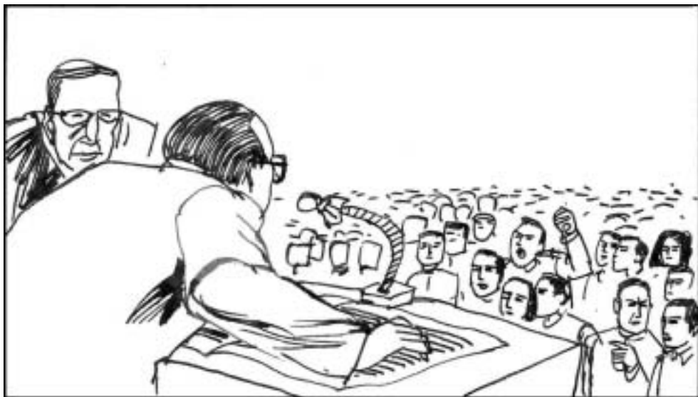
5. 江泽民故技重施，带着上海市委宣传部长陈至立去学校发表演讲。他戴着老花镜，摊开一张纸，大谈“经济五年计划的成果”的陈词滥调。引得学生们嘘声一片，开始喊口号。