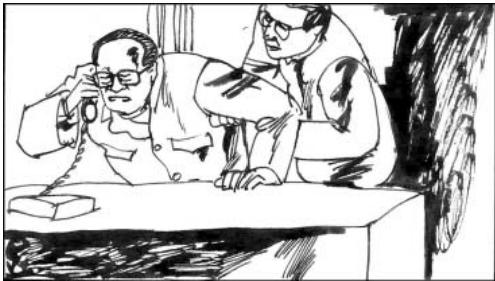
11. 江泽民一回到办公室就亲自打电话给上海交大的党委书记何友声，让他到陈至立那里去取下午发言的学生相片，一定要找出这些学生的姓名和所在班级。