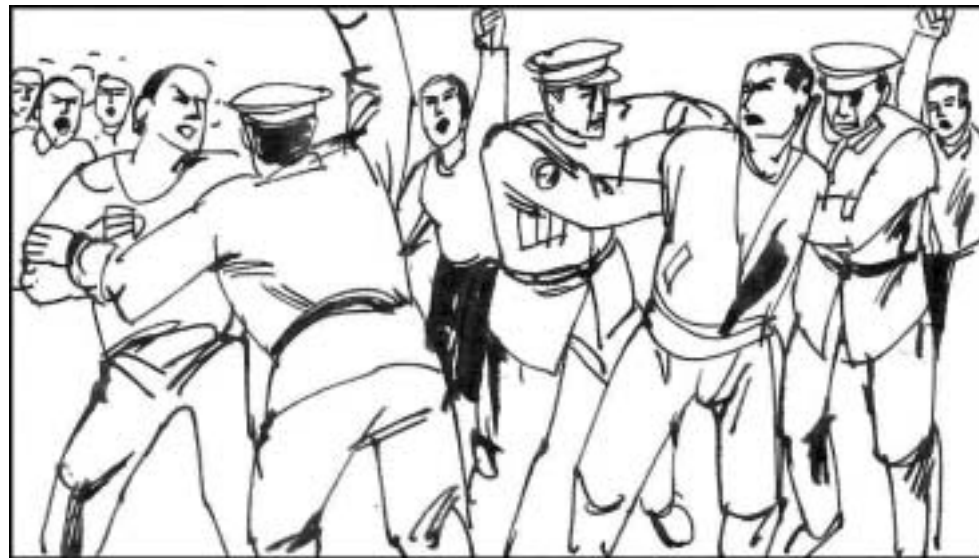
12. 江泽民和学生对话的第二天，学生们涌上街头游行集会，要求继续与江泽民对话。江紧急调遣 2000 名警察强行抓捕、疏散学生。学生们一哄而散。江泽民尝到了强权的重要和武装镇压的甜头。