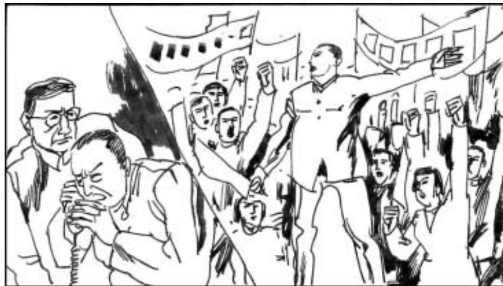
4. 86 年底，科大党委不准许学生与官方指定的候选人进行人大代表竞选，直接引发学潮，席卷全国。上海的学生要求与江泽民对话，提出政治改革和民主要求等。