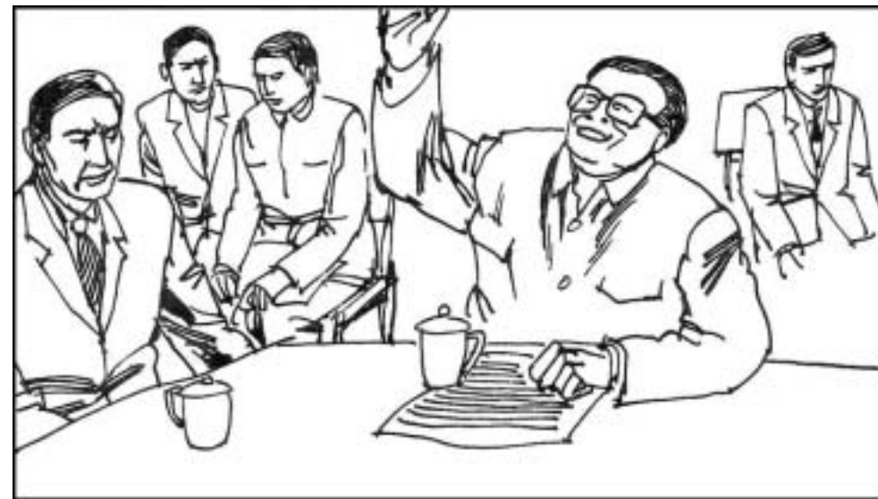
2. 江泽民对媒体的关注近乎一个偏执狂，他代替市委宣传部和市里所有主要媒体的高级编辑开会。历任市长从未有此先例，不过这却成了江的一个例行的主要工作。