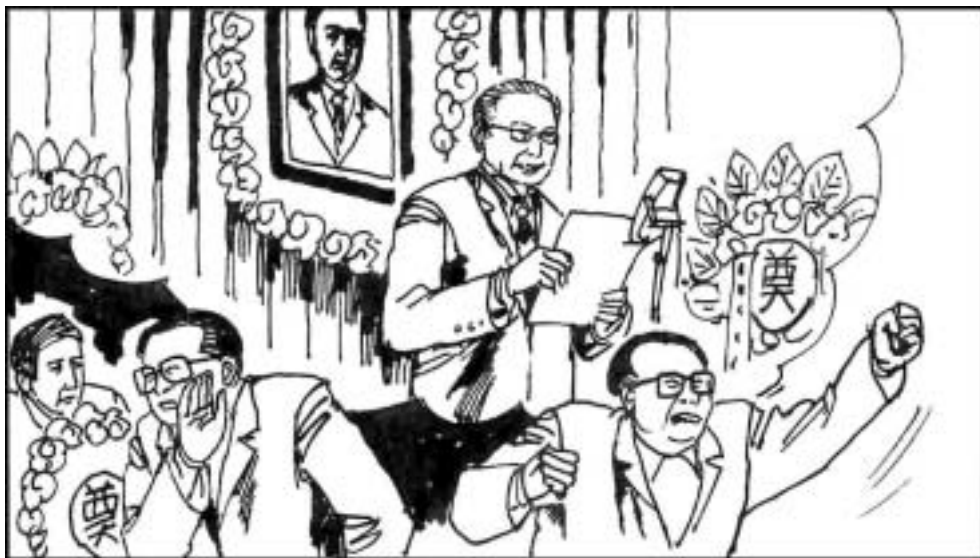
7. 4月22日上午，胡耀邦的追悼会在人民大会堂召开。仪式由杨尚昆主席主持，中国大部分高级领导人都参加了。江泽民一面在上海反对悼念胡耀邦，一边送去花圈以示“悼念”。