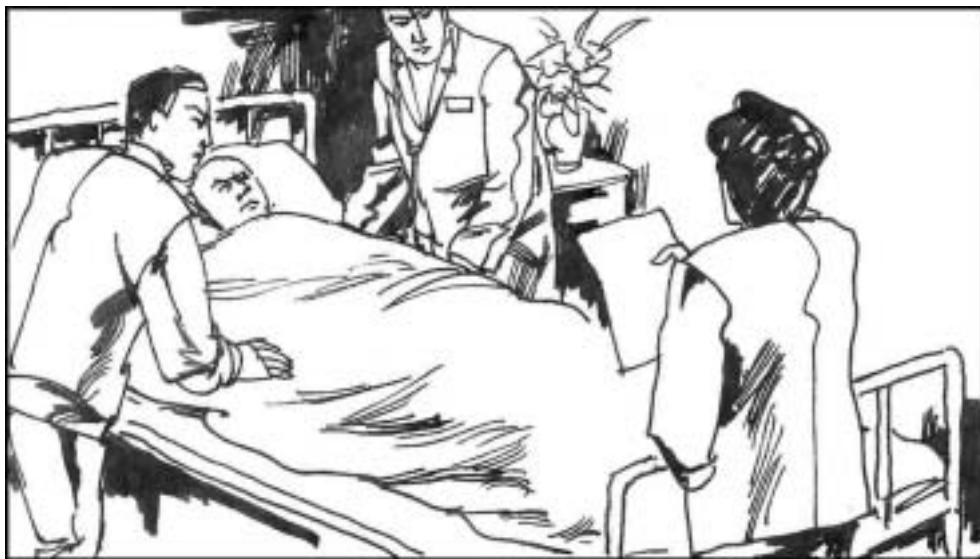
13. 钦本立癌症晚期起不来床时，江泽民的亲信陈至立笑眯眯的去了病房。大声宣读了钦本立的党纪处分。她不但要刺激这位 70 岁的老人早些死，还要他死也不得安宁。