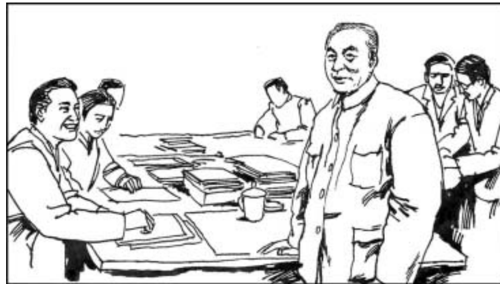
8. 《世界经济导报》的创办人及主编钦本立是一位70多岁很受编辑尊重的老知识分子。这个刊物倡导民主思想，在30多万高层次读者中信誉很高，在全国性的讨论定调方面影响力极大。