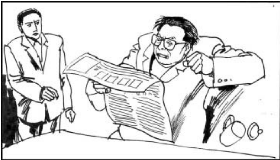
3. 江泽民在一次记者会中炫耀他的英文，不恰当的使用英文词汇“Faces”代表“面貌”一词，当《解放日报》第二天负责地将“Faces”用“面貌”代替，以便使老百姓人人看得懂时，江泽民却大发脾气。