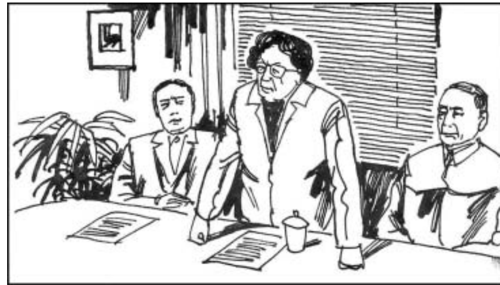
12. 4月27日，江泽民派刘吉、陈至立负责的“上海市委整顿领导小组”进驻《导报》。整起人来不比江手软的陈至立对江泽民言听计从。她遣散《导报》员工，还特别下禁令不许《导报》的编辑再做记者。