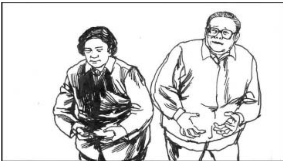
13. 江泽民在 1999 年镇压法轮功时声称从来没有听说过法轮功。其实王冶坪 1994 年就跟人学过法轮功。王练功时江也在旁边偷偷比划，一次被王发现，江恼羞成怒，不许她再练。他说：“连我老婆都信李洪志了，谁还来信我这总书记！”