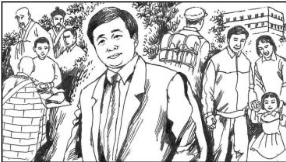
1. 法轮功创始人李洪志先生 1951 年 5 月 13 日生于吉林省公主岭的一个普通知识份子家庭，从童年起修炼佛家独传大法。参过军，后转业到长春市的一家粮油公司。他是一个普通职员，一家人住在单位简陋的宿舍楼里。