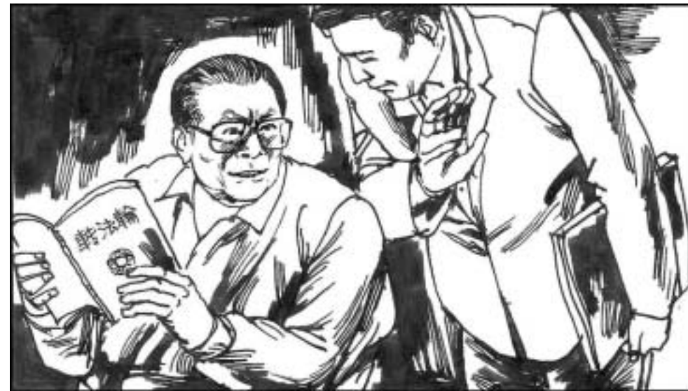
14. 江泽民开始也不反对法轮功，还看过《转法轮》。但江最感兴趣是想托人向李大师打听自己的前世、预测自己的政治前途和怎么保住权位等。李先生看透了他的心思，表示治病可以，不问政治。江从此怀恨在心。