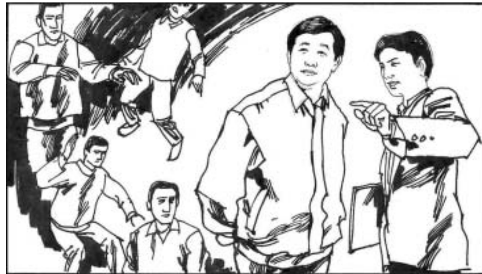
6. 李洪志先生 1992 年传功讲法的时候，中国气功师多如牛毛，真伪俱在，鱼龙混杂。虽有许多人从太极拳、五禽戏等传统功法中获得了身体的健康，但上了假气功师的当、花了冤枉钱却治不好病的也不在少数。