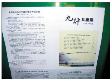
2005年9月间，石家庄街头的退党宣传彩页。