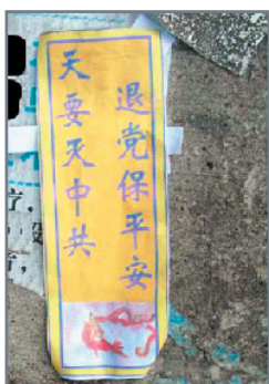
广东韶关曲江的退党标语。

近日来在全国各地不少城市的街头巷尾，人们不时看到有关九评和退党消息的标语，横幅，不乾胶粘贴，退党捷报、退党图册等。