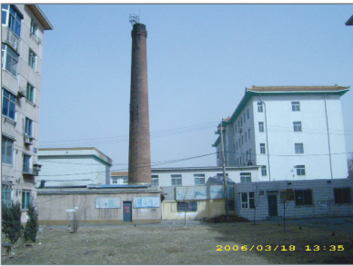
血栓病医院西面南侧的焚尸炉，常徐徐冒白烟。

集中营设在辽宁省血栓中西结合医院後院，整个设施设在地下，该设施处於高度警卫的封闭状态，有自己的供应系统，包括地下商店。