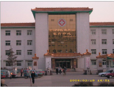
苏家屯血栓病医院北面正门。