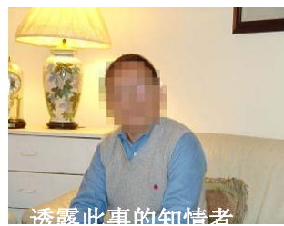
透露此事的知情者