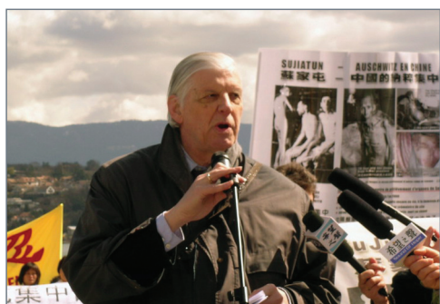
联合国「国际多元信仰组织」秘书长查尔斯·格劳福斯先生

【联合国信仰机构秘书长】欧洲多国法轮功学员於2006年4月4日在日内瓦举行游行集会，强烈抗议中共肆意杀害法轮功学员并贩卖其人体器官之恶行。联合国「国际多元信仰组织」秘书长表达强烈谴责。