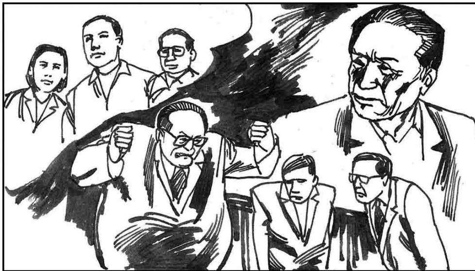
15. 沈阳市公安局副局长韩广生 2001 年 9 月出逃到加拿大。他说“当时首要的任务是阻止法轮功学员进京上访。沈阳市如果在一个月内有三个以上的法轮功学员进京上访，副书记甚至书记要做检讨。各市只好动用警力财力来截访。”