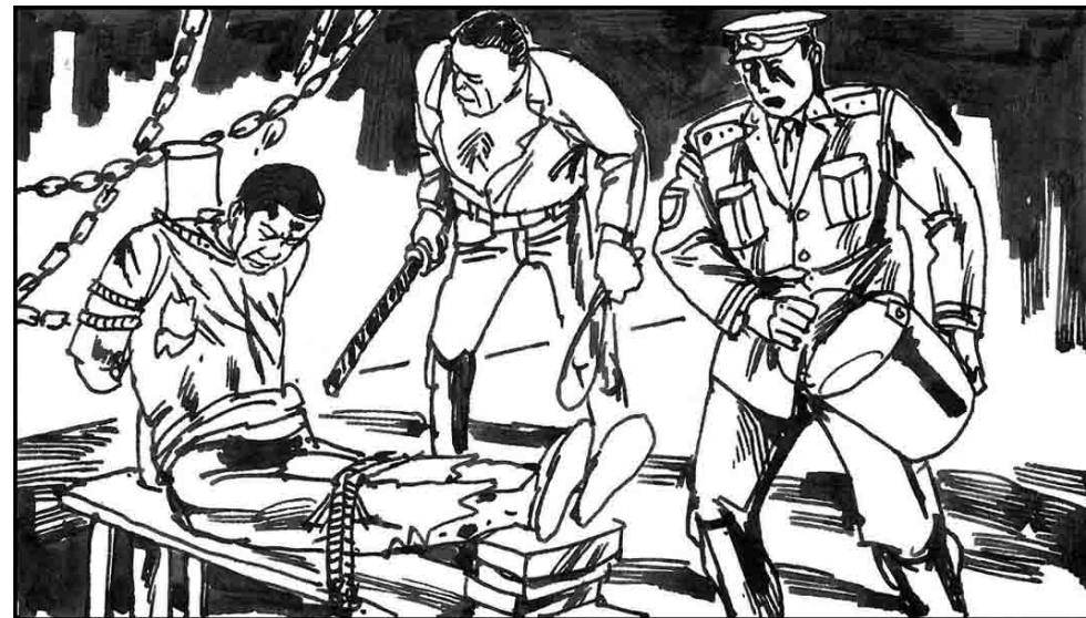
4. 此时江所能做的就是用权钱加紧收买，江泽民规定“610”新老成员和劳教所警察奖金、升迁等要和被关押法轮功学员的“转化率”联系。在江和中共的威逼利诱下，一些人丧失了良知，用残酷手段折磨法轮功学员。