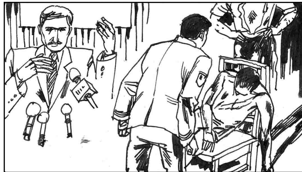
14. 第三名出逃澳洲的不愿透露姓名的前中共公安人员通过堪培拉律师克拉瑞告诉澳大利亚广播公司晚线栏目，“他听到警察局中的毒打声，赶去干涉，他被告离开。他看到那个裸体男人的头倒在椅子中，双腿伸开，已经死去。……”