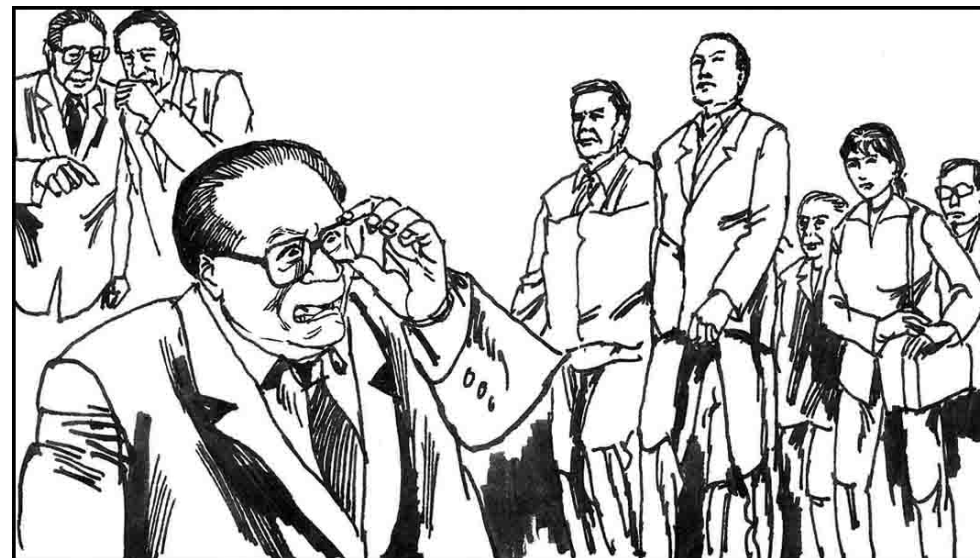
2. 政治局里有人看江的笑话。江对精神信仰力量的理解仍然停留在中共阶级斗争的旧思维中。尽管使用中共几十年整人手段的精髓来迫害，法轮功依然不屈服。法轮功学员只是和平请愿，从不还手。江不知道怎样才能吓住法轮功学员。