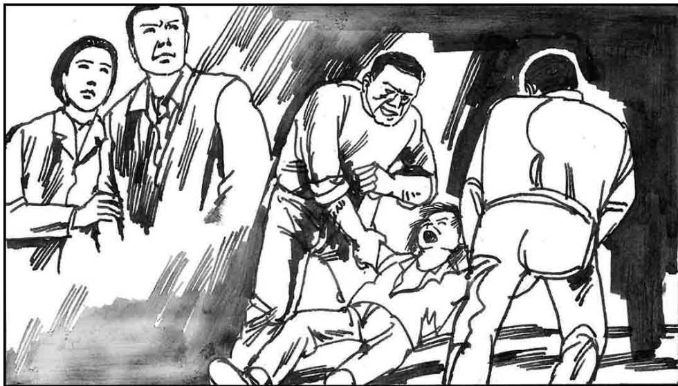
7. 参与迫害的还有精神病医院，那里除了警察就是打手，根本就不是医院，他们对正常人使用精神药物迫害，昌平精神病院的打手每晚强奸一名九岁的小女孩，她父母都因修炼法轮功被迫害致死。