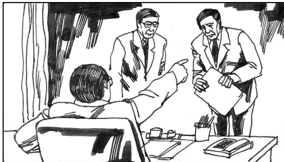
8. 但仍有人不愿配合迫害。江见迫害力量还不够，就将国内安全保卫局原政保处和“610”办公室工作合并起来，以加大打击法轮功的力度。职权范围很大，可以布置检查工作，并可对同级单位下发指令。