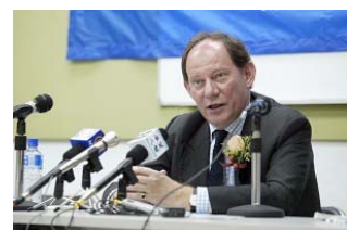
欧洲议会副主席爱德华·麦克米兰·史考特。

欧洲议会副主席爱德华·麦克米兰·史考特在结束他在中国大陆为期 3 天的真相之旅后，5 月 24 日在香港举行的新闻简报会上指出，中共政权 10 年不变，依然是一个“残暴、专制和偏执”。他肯定共产政权必须解体，对大陆的退党大潮表示支持，并认为退它几十万人并不足够，希望百分之百的中共党员都来退党。