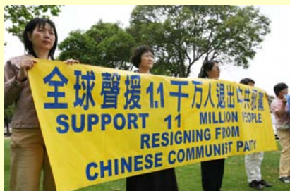
洛杉矶退党服务中心等团体于 6 月 10 日举行集会，声援 1100 万人“三退”。

2004 年 11 月 18 日大纪元时报登载系列社论《九评共产党》，从各个层面揭示共产党的真实历史面貌，由此开启了一场重大精神觉醒运动。全球退党服务中心代表高大