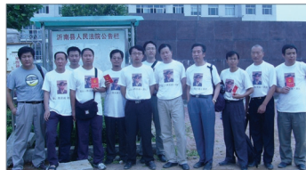
高智晟等维权人士声援陈光诚

据了解，如没达到中共计生政策生育指标，地方官只好辞官走人，所以各计划生育官员无所不用其极地想尽办法“达标”。其残忍手段包括：捆绑年轻孕妇强行堕胎、做人流刮宫、杀死成熟婴儿等。高智晟律师表示，地方政府和中共高层的价值观是一致的，其残忍作恶与中共政权密切相关。