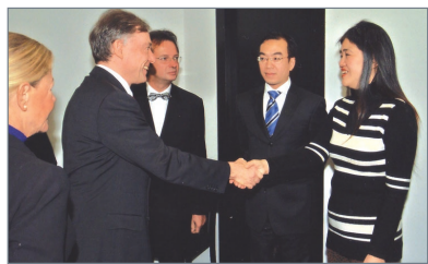
沈婷领奖时和德国总统握手合影