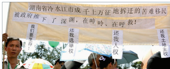
湖南游客在七一游行中争取人权

分析人士指出，游行人数比去年多，反映出中共在大陆的残暴行径，使市民诉求普选的呼声越强烈。若香港实现普选，势必对中国民众与日俱增的民主意识产生巨大影响，