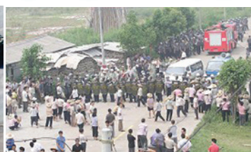
2005年9月12日番禺区政府出动