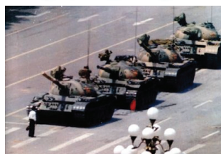
1989年6月4日中共在天安