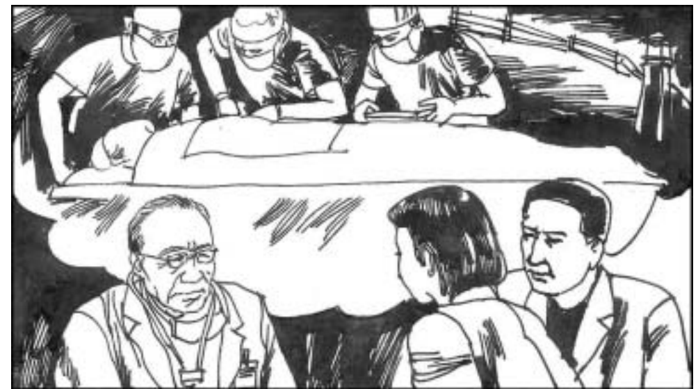
6. 苏家屯活体摘取器官的事实被揭露后，又传来了更多的有关消息。在大陆的一位老军医说，据他了解，仅苏家屯这样的秘密集中营，全国至少有36处。在普通的劳教所，也都在发生着活体摘取法轮功学员器官的事。