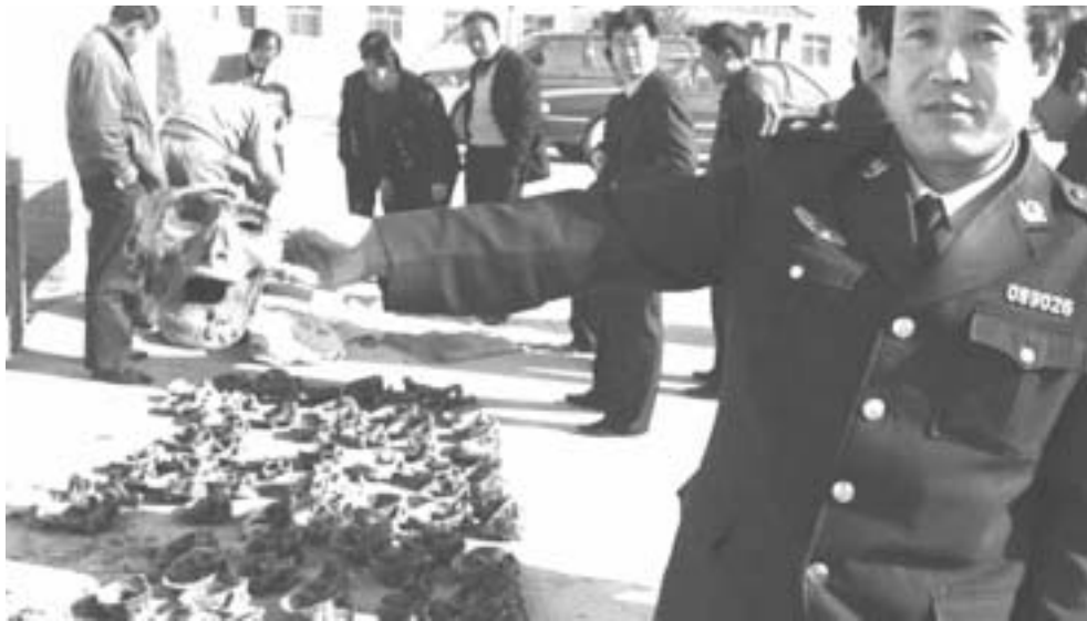
9. 99年7月镇压法轮功后，中国邪事不断。06年2月25日，甘肃一牧羊人在天祝县大湾口发现很多人头，竟有121个，这些人被害时间不久，面部肌肉尚存，天灵盖都被齐耳锯掉，面部表情非常惊恐痛苦。