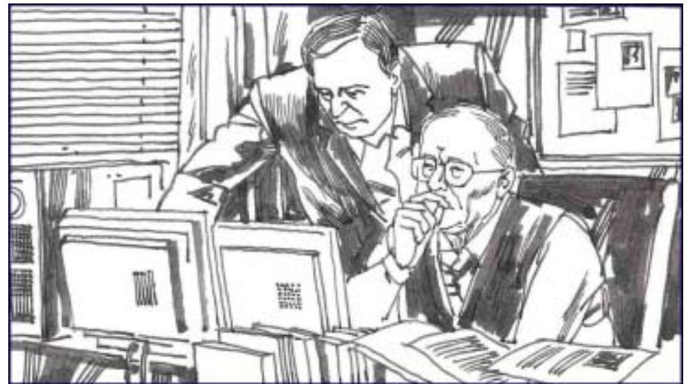
10. 同时，加拿大前亚太司司长、资深国会议员大卫·乔高和国际人权律师大卫·麦塔斯受“法轮功受迫害真相联合调查团”（CIPFG）的委托组成的独立调查组也在加紧工作，调查中共活体摘取法轮功学员器官的真实性。