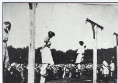
纽伦堡国际战犯法庭经过对纳粹集中营死亡护士组在对犹太人的种族灭绝中所犯罪行的认定，於1946年对她们执行死刑。

1947著名的“纽伦堡审判”，以“反人类罪”将23名纳粹医生押上审判台，7名纳粹医生被处以绞刑。纳粹骇人听闻的实验实施者是以救人为天职的医生，世界