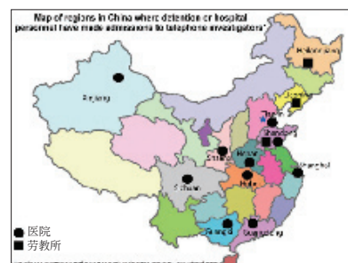
活摘器官事件相关医院和劳教所在中国的分布图