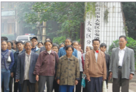
村民获释与迎接的乡亲和合影

四川自贡市3万农民，被中共以建立汇东高新技术开发区为由，强行占用红旗乡农民的土地，涉嫌谋取暴利金额高达50亿元，造成3万农民失房、失地、失业，农民生活失去保障。村民坚持维权付出了12年的重大代价后，人民终於开始觉悟。他们已经知道要期待中共能变好、能还他们公道，已经是“日头西起”不可能的事了。只有让中共彻底解体消失，才能看得到未来。