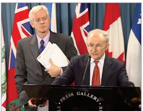
大卫·乔高(左)和大卫·麦塔斯(右)

前加拿大亚太司司长大卫·乔高和著名加拿大人权律师大卫·麦塔斯呼吁关注北京人权律师高智晟，并将提名高为2007年“诺贝尔和平奖候选人”。2006年4月在白宫向胡喊话停止迫害法轮功的医学博士王文怡也表示，高为法轮功上书触怒北京当局被逮捕，她将推动高成为诺贝尔和平奖获奖人的努力。