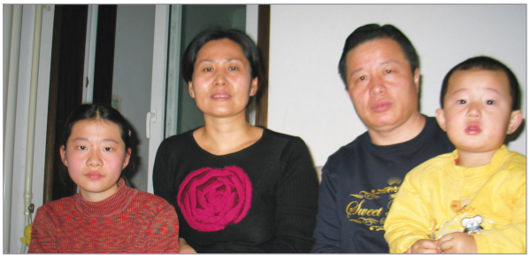
高智晟律师与妻子耿和及儿女的合照

中国著名维权律师高智晟2006年8月15日被中共当局非法抓捕后，他的夫人及两个未成年的孩子均遭到中共变相监禁，13岁的女儿格格遭受警察语言的羞辱和暴力，以及长达2个月的24小时监控，几次出逃并向外界呼救。