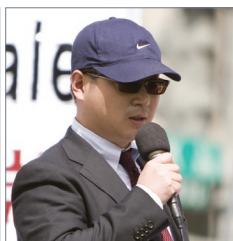
中国驻日记者彼得