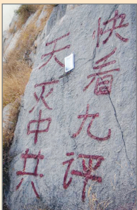
济南大佛头游览区大石头上涂写标语