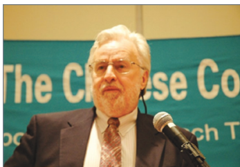
加拿大著名律师科来福·安世立