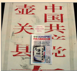
山西省壶关县太行山大峡谷旅游区被张贴“三退”不干胶和“九评”宣传画