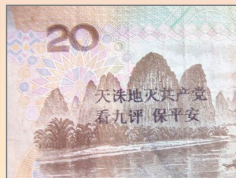
退党币流通全国各地