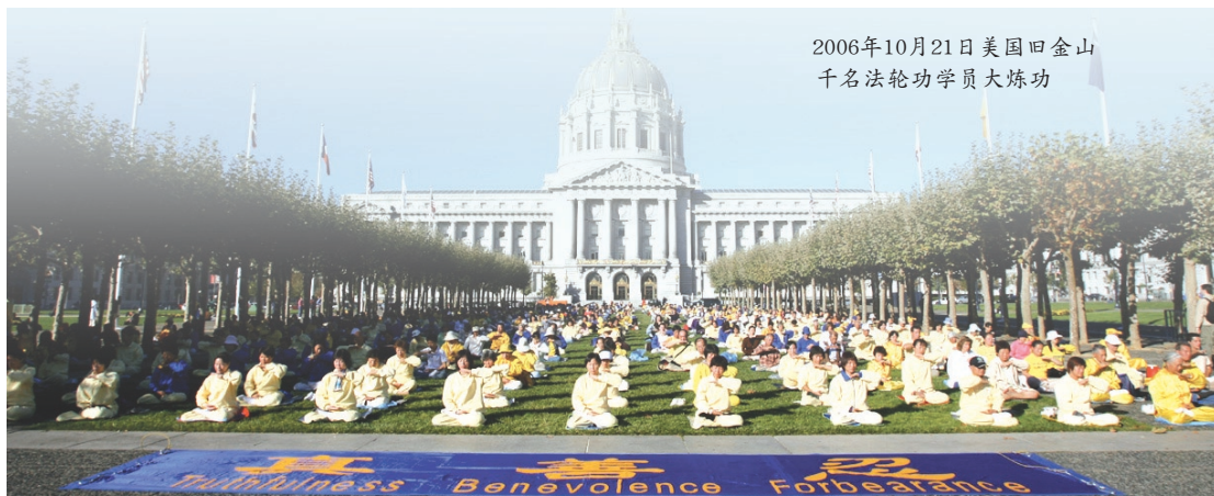
2006年10月21日美国旧金山 千名法轮功学员大炼功

有人说这首歌能解释法轮功学员为何甘冒生命危险，坚持为中国人讲清真相。正如歌中所说：“可贵的中国人啊，你可知道全世界都说法轮大法好，切莫错过这万古机缘。”