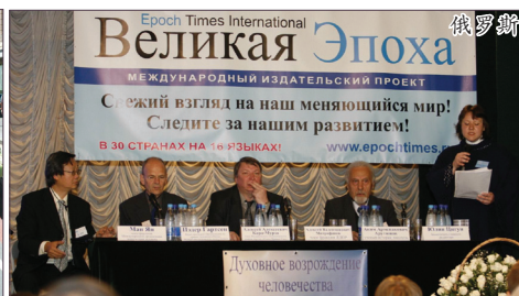
2006年9月28日在莫斯科记者之家举办了主要议题为“没有共产主义的未来”的九评研讨会。