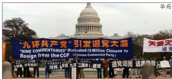
2006年11月11日下午，在美国国会前举行“庆祝九评二周年及1500万中国民众退党”的公共集会。

最畅销书籍。自6月起，连续两周名列教保文库政治/社会类图书的最畅销书第一位。教保文库职员说：“《九评》对中国共产党在80多年的历史中对人权的肆意践踏和对人民的残酷镇压作了全面揭露。大部份读者是学生和60年代出生、经历过民主运动的人。”