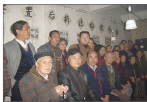
人权展下的伸冤访民

11月30日，湖北花楼区居民因拆迁问题上访，中共当局派出数百武警镇压，造成多位居民严重受伤送医。12月1日小区居民召开维权声讨大会，痛斥中共当局只会用暴力对付老百姓，同时，他们表示不怕流血牺牲，将会维权到底，保护家园。