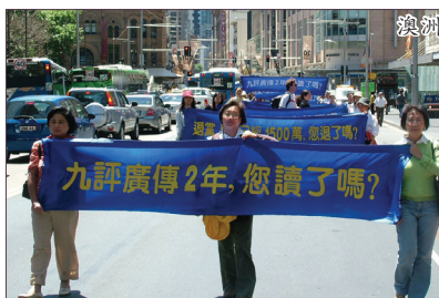
2006年11月5日在澳洲悉尼举行声援退党及欢庆九评二周年集会游行。