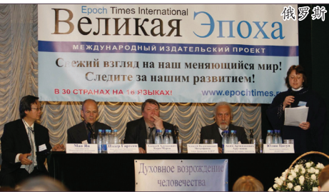
2006年9月28日在莫斯科记者之家举办了主要议题为“没有共产主义的未来”的九评研讨会。

2004年11月19日，大纪元发表了《九评共产党》系列社论，从历史、政治、经济、文化、信仰等层面深刻揭示了中共的欺骗、暴力、邪教和流氓本性。二年来，华人世界出现一起波澜壮阔的精神解放运动，中共红墙因此而摇摇欲坠。