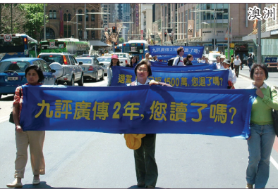
2006年11月5日在澳洲悉尼举行声援退党及欢庆九评二周年集会游行。