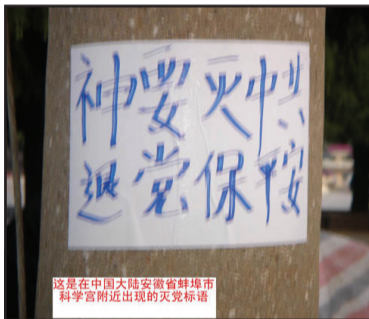
这是在中国大陆安徽省蚌埠市科学宫附近出现的灭党标语