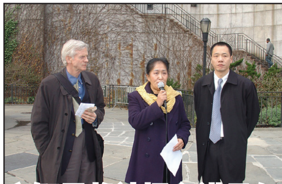
图：加拿大前亚太司司长国会会议员大卫·乔高（左），王文怡医生，乔高和平民主联盟主席唐柏桥。（大纪元）