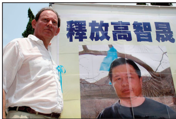
图：欧洲议会副主席爱德华·麦克米兰·斯科特要求中共立即释放高智晟律师，他表示：审高智晟者将受惩罚。

2006年12月12日中共当局「公开」审理高智晟案，不允许旁听，不通知家属，并拒绝让家属委托的辩护律师出庭。在整个过程中，当局都是亵渎法律，公开执法犯法。在国际社会、中国民间正义力量强烈谴责和压力下，北京法院12月22日以「颠覆国家政权罪」判处高智晟三年徒刑，缓刑五年，剥夺政治权利1年。高智晟律师於当天晚上回到北京家中，但仍未获得自由。