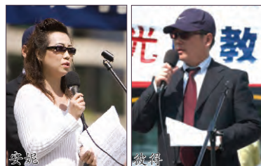
2006年3月9日一名记者彼得向大纪元媒体揭露在辽宁沈阳

的苏家屯设有一秘密集中营，关押大量法轮功学员并摘取他们的器官牟利，集中营里并没有焚尸炉。