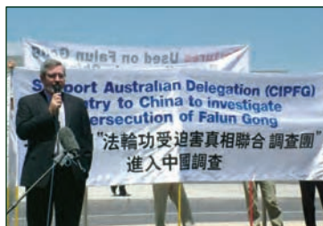
调查团成员之一澳洲民主党参议员巴特雷特先生

2006年10月20日，法轮功受迫害真相联合调查团(CIPFG)发表拟赴大陆调查通报，鉴于