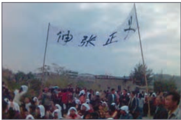
汕尾村民以白布披头盼正义之士伸援

2005年12月6日，约2000名广东省武警在汕尾市东洲镇，向上千名讨要因修建发电厂而被侵占土地补偿费的村民开枪。据村民告知，有30多人被打死。血案已过去一年多，村民要求政府给予合理土地赔偿，促查当地官员贪污问题，严惩射杀村民的凶手，但至今问题仍未得到解决。一村民表示，“现在东洲村民对(中共)政府彻底失望。村民一定会维权到底的。”