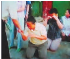
失地农民跪求当地官员

广西省巴马瑶族自治县因当地政府强行徵用农民土地，导致上万失地村民生活陷入困窘，而巴马官员的豪宅却富丽堂皇。据当地失地村民透露，近期，巴马失地农民拟大规模的集体上访，多次到县政府“要土地、要吃饭”，并抗议当地官员的贪污腐败行为。