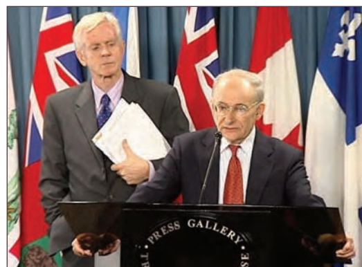
加拿大前亚太司司长大卫-乔高(左) 国际人权律师大卫-麦塔斯(右)

继2006年7月6日公布的“中国活体摘取法轮功学员器官调查报告”，加拿大独立调查员大卫·麦塔斯和大卫·乔高於1月31日再度公布中共活摘器官报告的增补版，将原有十八种论证方法扩充到三十三种。