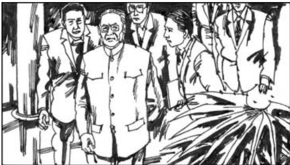
5. 姬鹏飞曾是中共外事系统实权派，也曾是接管香港的首脑人物。历任国务院副总理、国务委员、港澳办主任、人大副委员长、中顾委常委，权高位重。