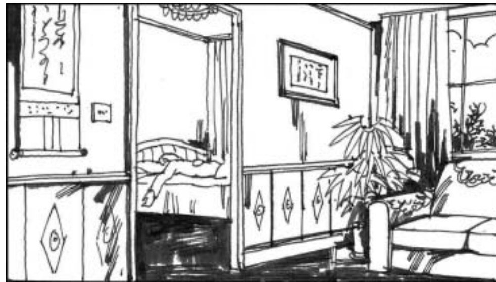
8. 正在北京香山养老的姬鹏飞曾先后四次写信给江泽民等请求宽恕独子姬胜德，免其一死，但遭到拒绝。姬鹏飞绝望之下于 2000 年 2 月 10 日 13 时 52 分服安眠药自杀身亡。