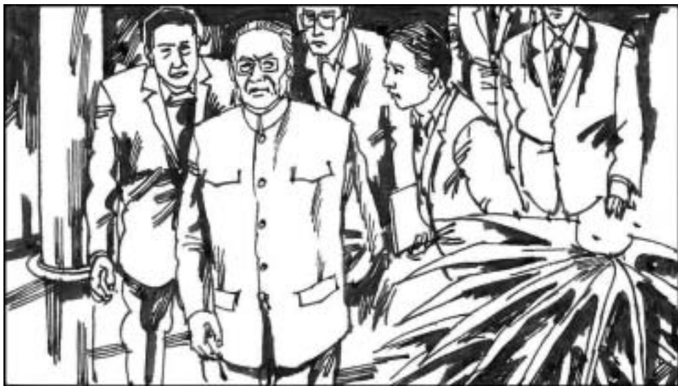
5. 姬鹏飞曾是中共外事系统实权派，也曾是接管香港的首脑人物。历任国务院副总理、国务委员、港澳办主任、人大副委员长、中顾委常委，权高位重。