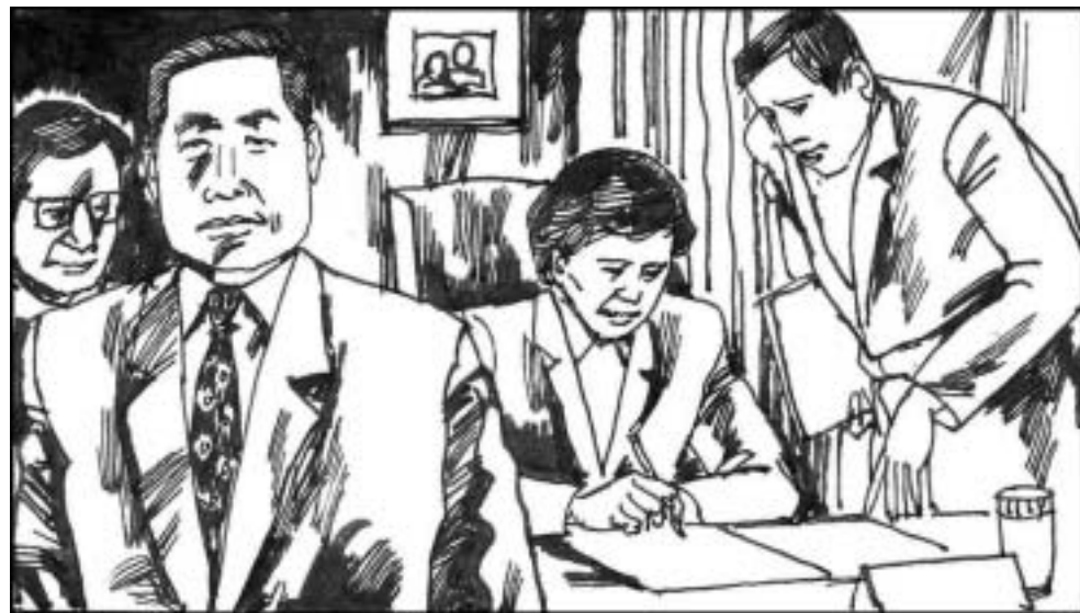
14. 远华案的另一个主要人物是江泽民的亲信贾庆林，时任福建省委书记和福建省人大常委会主任，他的太太林幼芳在中国外贸集团福建省总公司任党委书记，与远华撇不清关系。