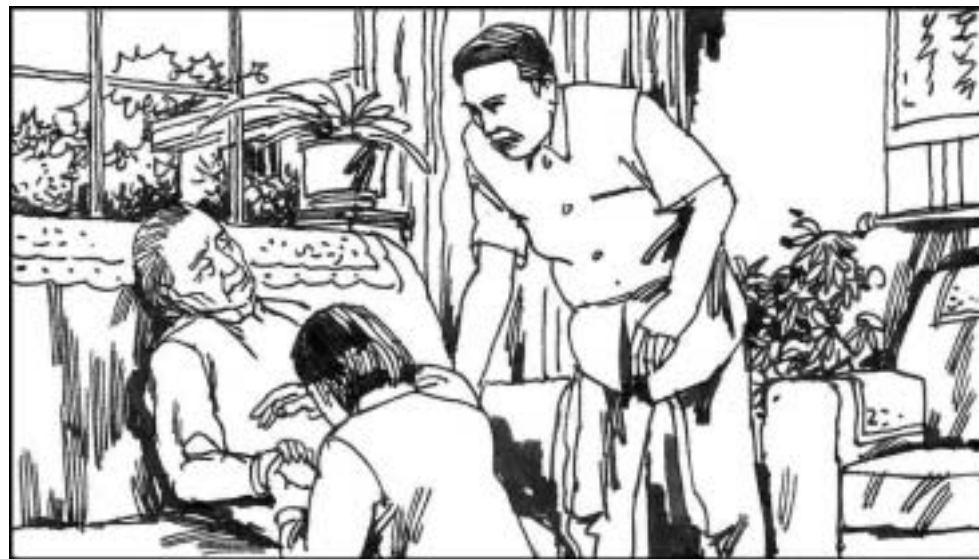
10. 姬胜德母亲许寒冰通过元老与遗孀路线为儿子争得死缓。江泽民拒绝了姬胜德保外就医的要求，还不准他母亲定期探望。许悲愤难抑，吞安眠药自杀被抢救了过来。