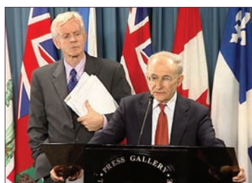
加拿大前亚太司司长大卫·乔高(左)和国际人权律师大卫·麦塔斯

告指出，对医疗系统来说，贩卖器官成为医院运营重要资金来源。中共军方许多医院，通过销售器官牟利。