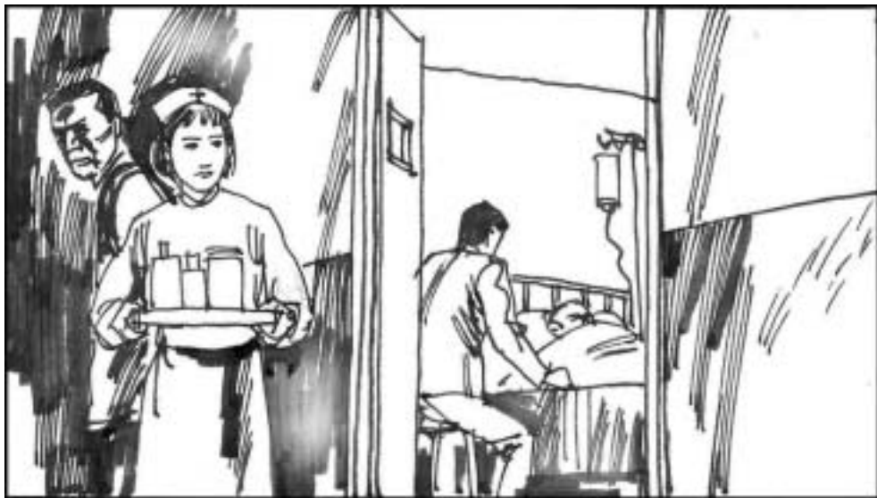
9. 江泽民特别“关心”的解放军总医院很快就被派上了用场。1998 秋，杨尚昆得了感冒，住进了完全被江泽民和曾庆红控制的解放军总医院。