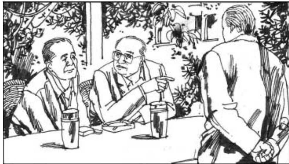
2. 97 年 2 月邓小平去世后，92 岁的杨尚昆身体并无大碍。他对江泽民在军队中乱提拔将军、收买人心、打击异己一直不满，时常在老干部聚会上数落江泽民。