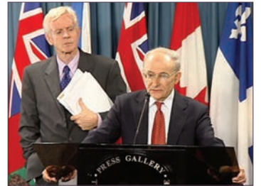
加拿大前亚太司司长大卫·乔高(左)和国际人权律师大卫·麦塔斯

加会大前亚太司司长、国会议员大卫·乔高和国际人权律师大卫·麦塔斯针在06年7月公布活摘器官的调查报告后，前往三十个国家巡访，采访了许多国家接受器官移植的人，在这近半年的继续调查中，获得