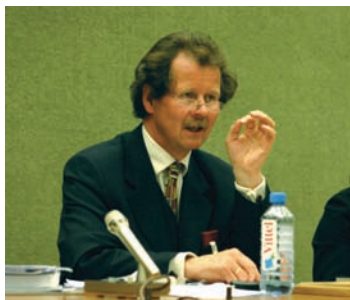
联合国酷刑专员诺瓦克

奥地利第二大杂志Profil於三月初发表了题为“迷失器官移植”(Lost in Transplantation)的文章，文中专访了联合国人权委员会酷刑专员诺瓦克先生，诺瓦克先生