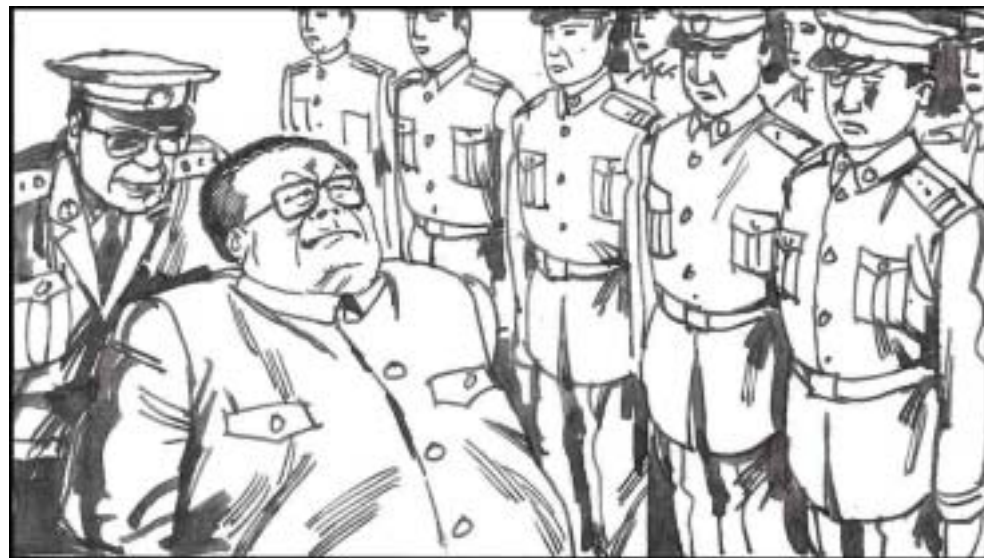
6. 江泽民处心积虑地监视其他中央领导，也担心自己被监视，对谁都不放心。江泽民卸任总书记职位后，更干脆以军委主席的身份，亲自兼任中央警卫局第一政委。