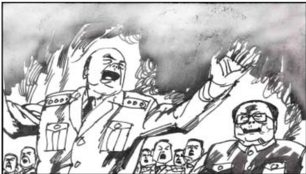
9. 1993 年江泽民又给了张万年一个上将军衔。张当着江的面，指挥全体总参机关干部合唱《枪杆子永远听党指挥》。江听了十分受用，张万年的马屁路线一击奏效，后来人有样学样，也斩获颇丰。