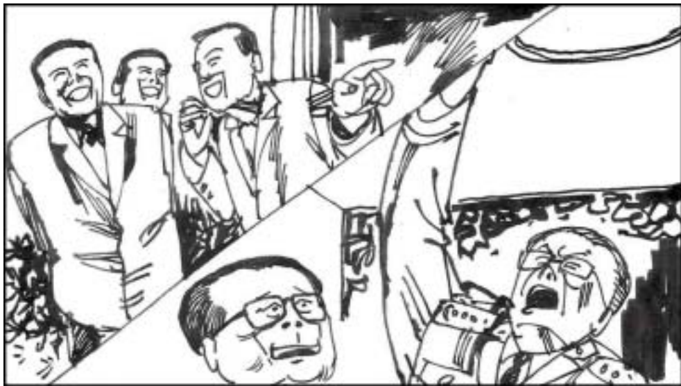
11. 于永波处处对江泽民拍马奉承，在 1992 年被江任命为总政治部主任。1993 年也被册封为上将。2001 年初，江在中南海怀仁堂宴请高级将领，于在席间高呼“江主席万岁”，一时被传为笑谈。