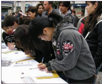
民众排队签名支持退党

罗斯女士想对中国民众说：“在独裁体制下，人们不能自由的思考，相反，民主的体制可以为你们带来思想的自由，行为的自由，信仰的自由，同时可以重新找回你们的根，你