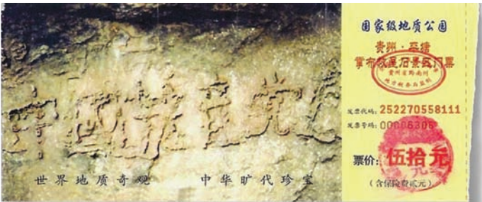
贵州平塘县掌布风景区发现2.7亿年的“中国共产党亡”藏字石