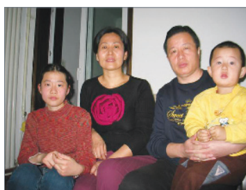
高智晟律师一家人

高智晟2006年8月15日被中共动员200多名警力秘密绑架关押了129天，期间受到酷刑审问，他被警察用铁链固定在铁椅上累计长达580多小时，其中有一次长达109小时；双手被拷住达600小时；被左右双向强光灯照射590多小时；被强制盘腿坐在地板上反思罪过800小时左右；被强制擦铺板385次。便衣警察还强行进驻高智晟家中监视他妻小，并以妻小及亲人的生存条件来威胁高智晟写了一封“悔过”的公开声明。