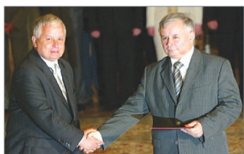
波兰保守派政府领导人卡钦斯基兄弟