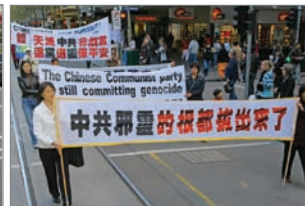
6月2日，澳洲墨尔本游行

自2007年3月24日以来，全球声援两千万人退出中共的大型活动已覆盖北美、欧洲及亚洲等10多个国家、近30个国际都市，声势浩大。在世界各地举行的退党集会，记录了中共解体前民心觉醒的历史场面。