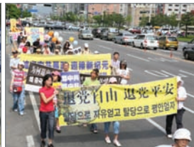
5月27日，韩国蔚山市游行