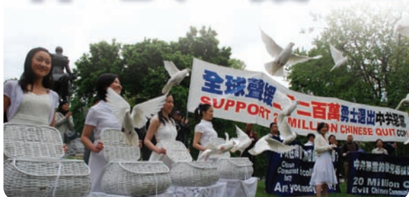
加拿大多伦多举办声援2200万人退出中共集会