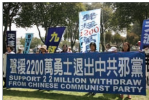
6月2日，美洛杉矶集会游行