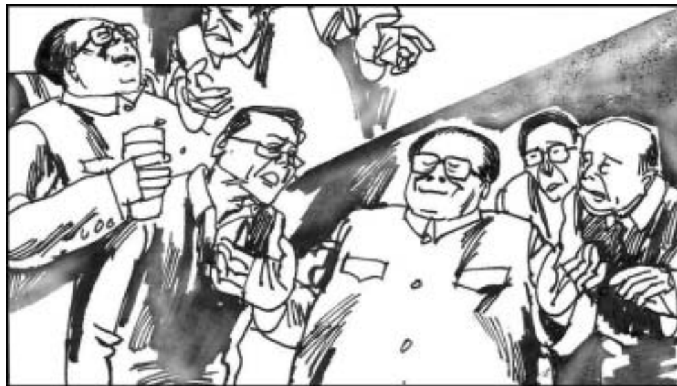
4. 滕文生对江泽民的最大贡献是“三讲”之一的“讲政治”。这个研究毛泽东的专家向江建议以毛的手段控制政治局：把权力分散，让二三个高级幕僚内斗，最后都要找江仲裁。