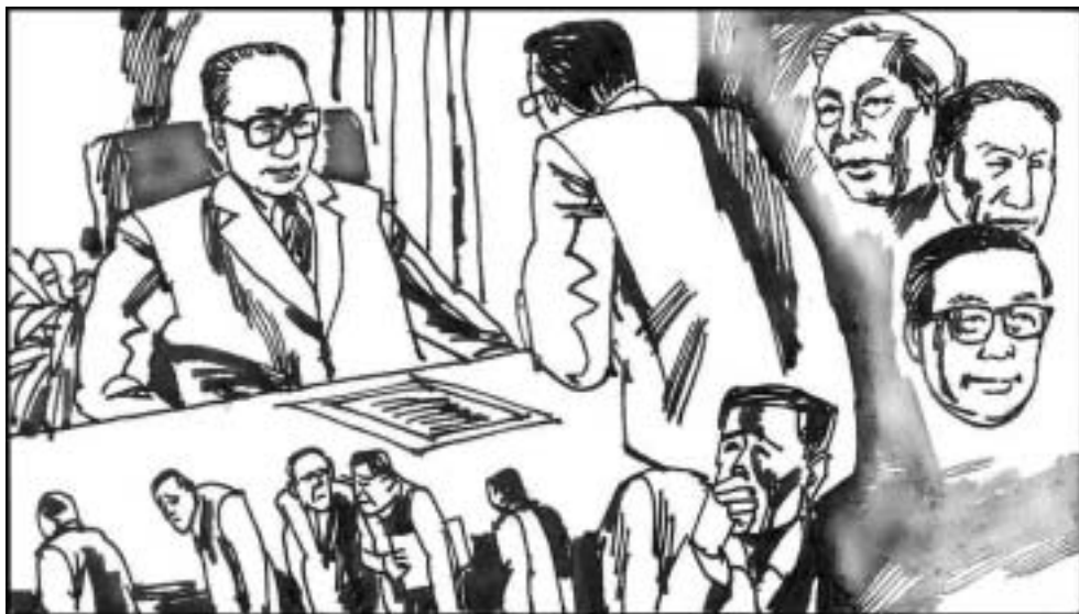
3. 滕文生 1980 年在中央书记处研究室工作时，专门收集各种开明人士的材料，方励之、王若望、刘宾雁等就是因为这些材料而被开除党籍。1987 年 9 月赵紫阳在邓小平的支持下撤销了这个研究室。