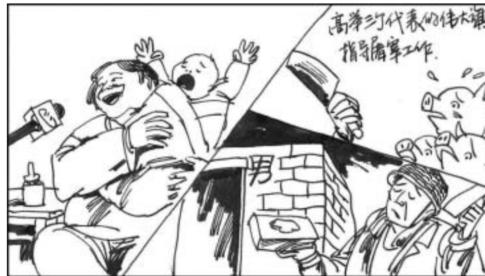
10. 全国学三个代表的闹剧下出了不少笑话，记者采访百姓，希望能有些三个代表的先进事迹，结果农村妇女生个胖儿子，说感谢三个代表，屠宰厂用三个代表指导屠宰工作，工人用三个代表为指针建设一流厕所等等。