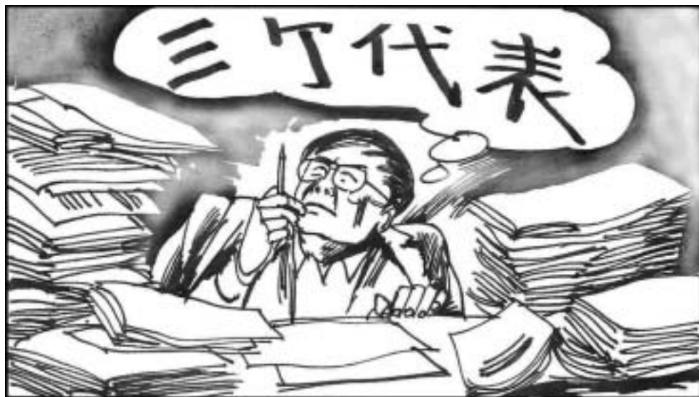
5. 王沪宁 1955 年 10 月 6 日生于上海，复旦大学国际政治系教授、博士生导师。1995 年在曾庆红和吴邦国的力荐下进入中共中央政策研究室，是“三个代表”的原作者。