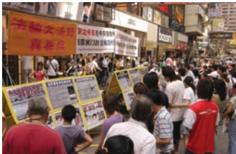
旺角真相点常吸引游客驻足观看

很多中国同胞一到香港，一看到敢对中共说不的声音，看到揭露中共邪灵的《九评》真相资料，他们心里的震撼，来自5千年文明优秀传统文化传承的人的本性会激发出来，会唤醒中国人的正义良知，推动大陆超过2,300万的中国人敢对中共说不，告别邪党组织。