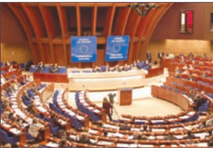
欧委会通过谴责共产罪行决议

17年前，东欧的共产主义阵营已经正式退出历史舞台，但人们并没忘记那些在共产主义极权政府统治下所犯的罪行。2006年1月25日，欧洲46个成员国代表在欧洲委员会讨论并通过决议“国际谴责共产极权政府罪行的必要性”。决议案本身谴责共产主义极权统治下普遍的人权侵犯。