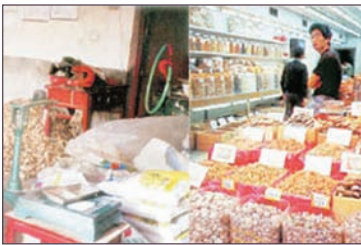
中国黑心商品泛滥消费者需小心防范

多年来中国黑心商品泛滥全球，而在中国境内是更加猖獗。根据调查显示，约百分之八十二的中国民众担心食品安全问题，而高达百分之九十一的受访者表示，曾在日常生活中遭遇过食品安全问题。亚洲开发银行的报告提出警告，中国每年至少有三亿人因问题食品而患病，并可能爆发大规模疫情，如同2002年至2003年期间的SARS（严重急性呼吸道症候群）疫情，使中国付出严重的社会和经济代价。