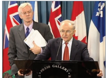
加拿大前亚太司司长大卫·乔高(左)和国际人权律师大卫·麦塔斯