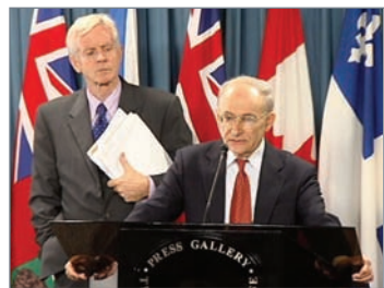
加拿大前亚太司司长大卫·乔高（左）和国际人权律师大卫·麦塔斯