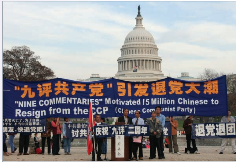
美国华盛顿庆祝九评发表两周年集会