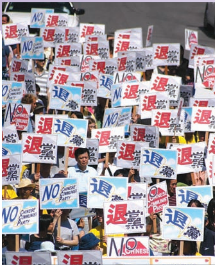
芝加哥1100万退党大游行

在全世界都关注这股风起云涌2500万的退党大潮，他们在多个国家、地区举办了800多场《九评》