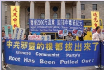
爱尔兰声援2000万人退党游行