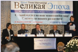
俄罗斯举办九评研讨会