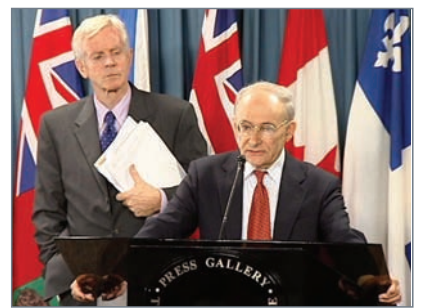
加拿大前亚太司司长大卫·乔高(左)和国际人权律师大卫·麦塔斯