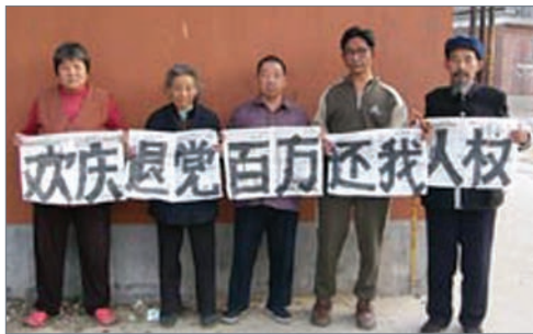
中国大陆民众欢庆百万人退党