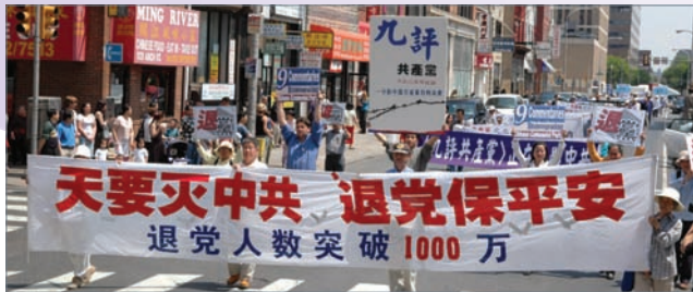
支持1000万华人退出中共费城华埠大游行