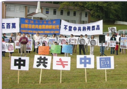
美国亚特兰大举办500万退党集会

自从2004年11月，大纪元时报发表《九评共产党》系列社论，从历史、政治、经济、文化、信仰等层面深刻剖析中共的欺骗、暴力、邪教和流氓本性。《九评》在中国大陆引发空前的退党大潮，至今，已经发展到2500万的退党大潮，接