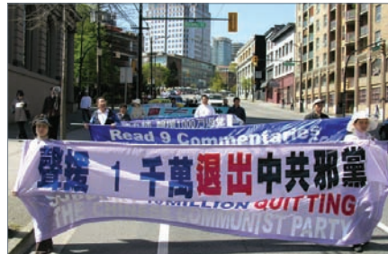
温哥华声援1000万退党