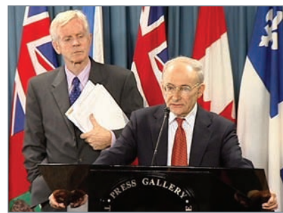
加拿大前亞太司司長大衛·喬高(左)和國際人權律師大衛·麥塔斯