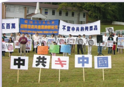
美國亞特蘭大舉辦500萬退黨集會

自從2004年11月，大紀元時報發表《九評共產黨》系列社論，從歷史、政治、經濟、文化、信仰等層面皆深刻剖析中共的欺騙、暴力、邪教和流氓本性。《九評》在中國大陸引發空前的退黨大潮，至今，已經發展到2500萬的退黨大潮，接