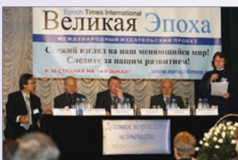
俄羅斯舉辦九評研討會