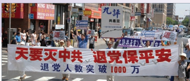
支持1000萬華人退出中共費城華埠大遊行