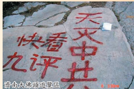
濟南大佛頭遊覽區