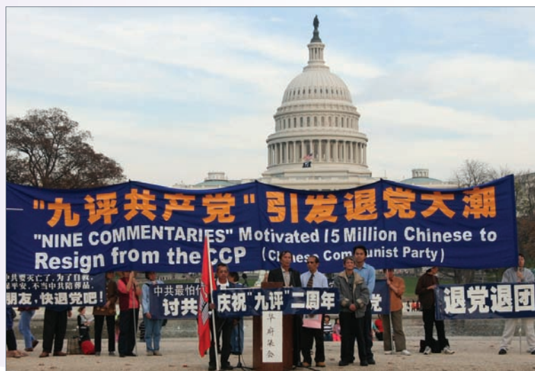
美國華盛頓慶祝九評發表兩週年集會