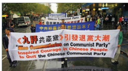
澳洲墨爾本舉辦聲援退黨的集會遊行 (2007. 4. 21)