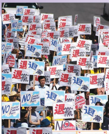
芝加哥1100萬退黨大遊行

在全世界都關注這股風起雲湧2500萬的退黨大潮，他們在多個國家、地區舉辦了800多場《九評》