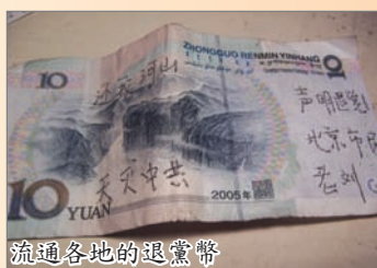
流通各地的退黨幣