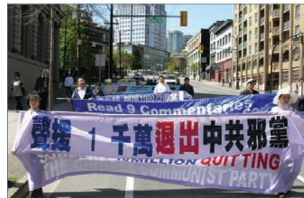
溫哥華聲援1000萬退黨