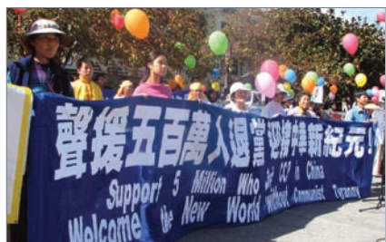
舊金山中國城花園角，舉辦聲援500萬人退黨的集會遊行 (2005. 10. 15)