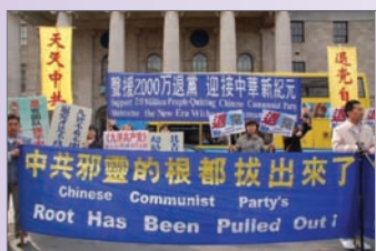
愛爾蘭聲援2000萬人退黨遊行