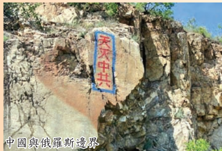
中國與俄羅斯邊界